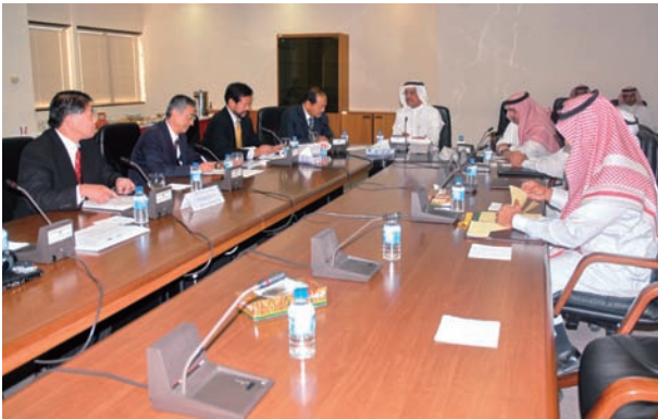
KACSTとの契約書調印式会場 中央：スワイエル総裁

本事業の実施によってサウジアラビアでのJCCP事業への理解を一層深めることが期待できます。