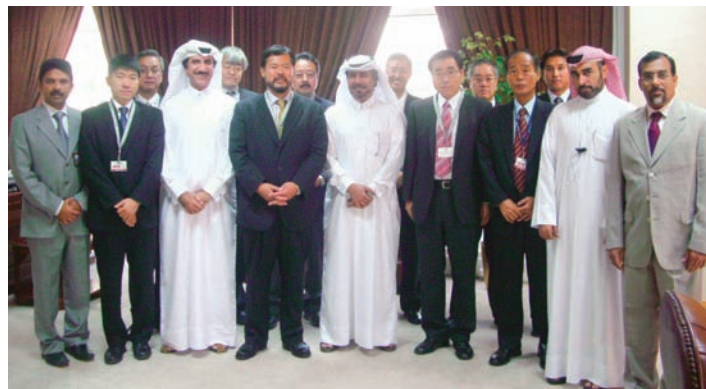
式典終了後の集合写真