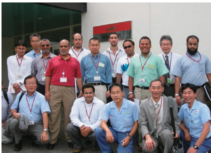
(株山武・伊勢原工場にて)