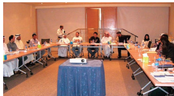
Hilton Kuwait Resort ホテルの研修会場

セミナー初日はビデオ上映を含めた「JCCP紹介」「日本の石油産業」「日本の代替エネルギー事情」「日本と製油所の省エネルギー概論」の講義を、JCCPの2名が担当しました。