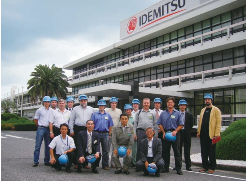
出光興産(株) 徳山製油所にて