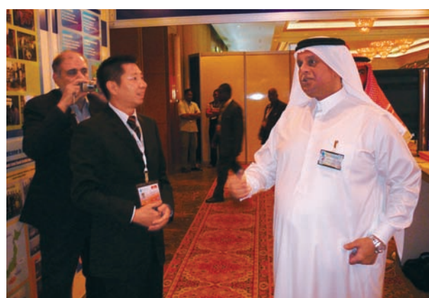
アティア副首相への説明