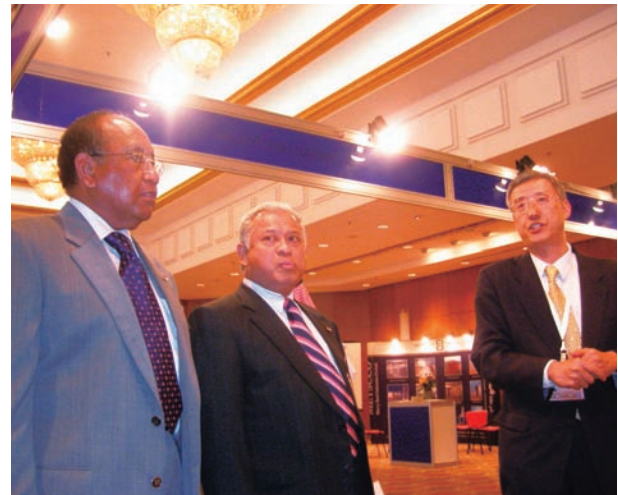
ユスイントロ エネルギー資源大臣（インドネシア）への説明