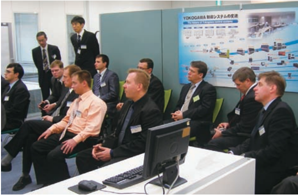
横河電機㈱ 三鷹本社デモルームにて