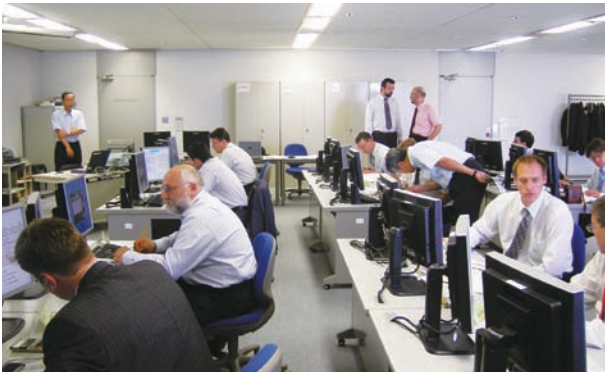
JCCP CAI ルームにて