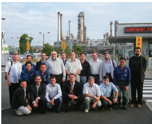
新日本石油精製(株) 根岸製油所にて

そこで、7月初旬にロシアの LUKOIL-Inform 社を訪問し、「プロセス制御」のテーマでESを実施（本誌194号・11頁参照）し、先方の研修団が来日し、「製油所のコンピューター化」のテーマでSTを実施しましたので、その概要を報告します。