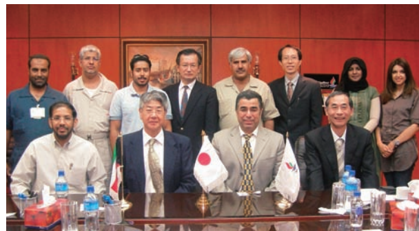
Mina Al-Ahmadi 製油所にて