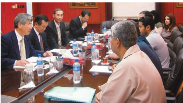
Mina Al-Ahmadi製油所にて 製油所スタッフとの会談