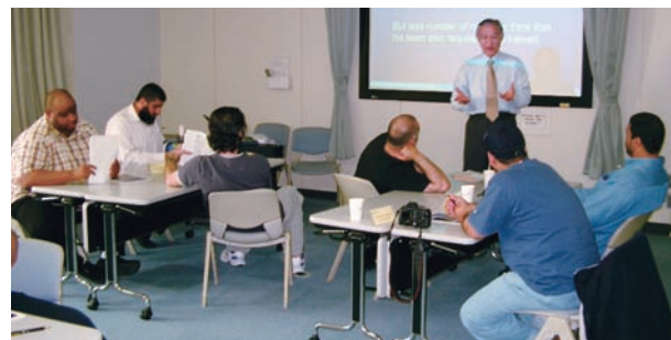
グループ討議風景

また日本独特のマネジメント方式である『創造的チームワーク』を紹介する研修のなかで、日本が資源がない国であるにも拘らず、なぜこれほどまでに成長したかを感じ取ってもらえたようでした。講師の巧みな話術と会話力、研修生を巻き込む講義により、研修生から高い評価を受けました。