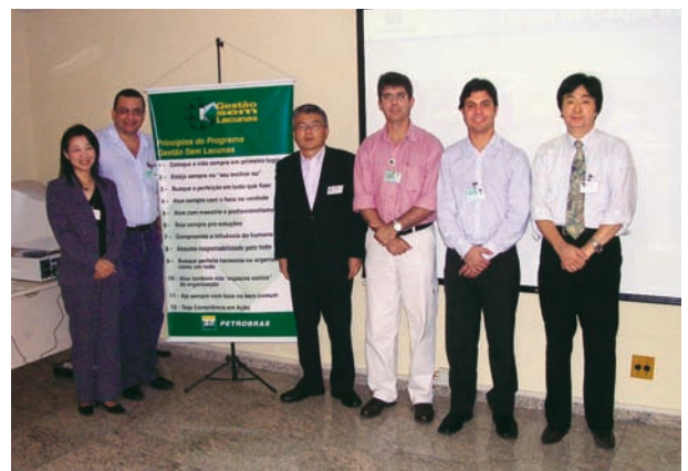
Duque de Caxias 製油所にて

当製油所は、1961年オペレーションを開始した大変歴史のある製油所で、精製能力は国内3番目の大きさですが、2次装置の能力や複合度は No. 1 であり、また、リオやサンパウロに近く大変重要な位置を占めています。