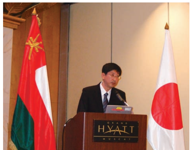
調印式挨拶 経済産業省 上條課長補佐