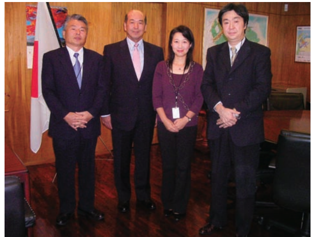
在ベネズエラ日本大使館 下荒地大使と

下荒地大使は、最近着任されたばかり (前任はパナマ大使) でしたが、JCCP 事業の背景等熱心に耳を傾けられ、またベネズエラの現況、治安や環境の問題、経済と社会の情勢について、小林一等書記官とともに詳しく説明して頂きました。