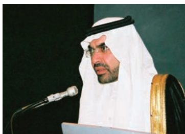
KFUPM スルタン学長挨拶