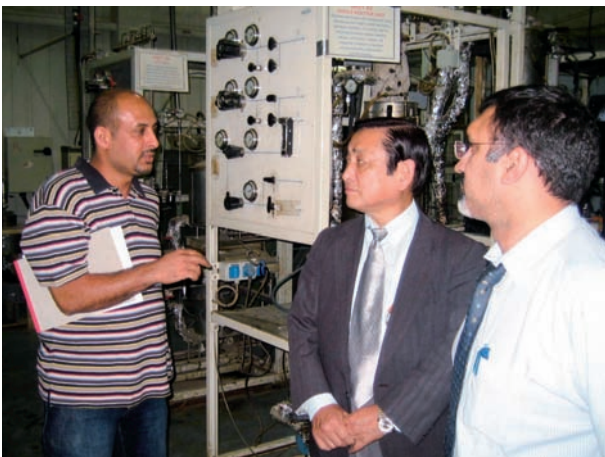
東博士、KISR 研究施設視察（平成 19 年 9 月）

現在は、今年度の約 3 ヶ月の派遣を順調に完了していただくことが第一の目標ですが、今回の経験については、研究者の方々のお考え、受け入れ機関の受け入れ状況等をよく把握して検討の上、次年度事業の発展に生かしていきたいものと考えています。