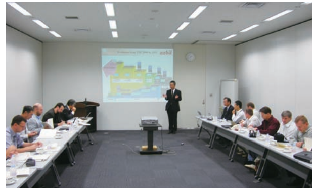
㈱山武 藤沢テクノセンターにて