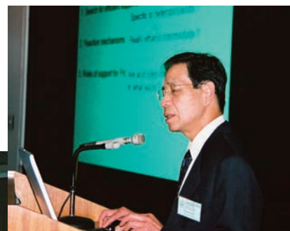
KFUPM 服部名誉教授発表