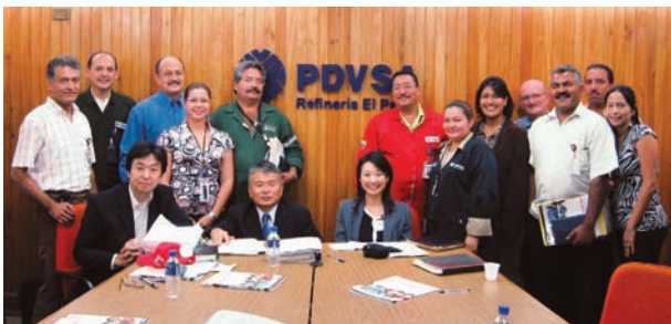
PDVSA El Palito 製油所にて

来年度の研修プログラムにも関心が高く、またメンテナンス部門の専門家派遣要請の意見もだされ、企業経由の専門家派遣についても PR しました。