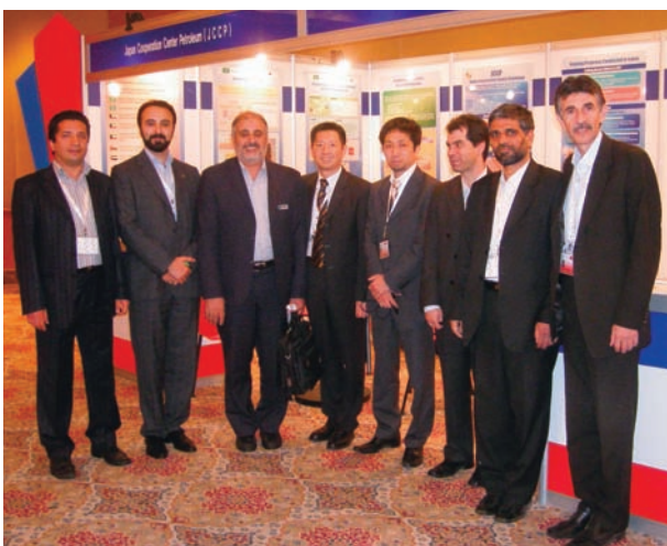
イラン展示会参加者とJCCPブース前にて