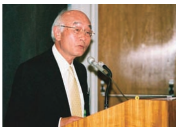
石油学会 菊地会長挨拶