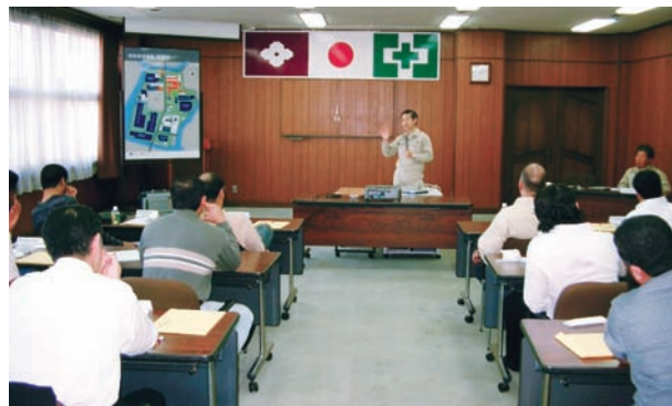
住友金属テクノロジー(株) 関西事業部

さらに、住友金属工業(株)関西製造所では、研修生全員が初めて配管類の最先端の自動化されたステンレスパイプ生産ラインを視察するとともに、ステンレス材料の特性、損傷事例とその対策事例について講義を受けました。