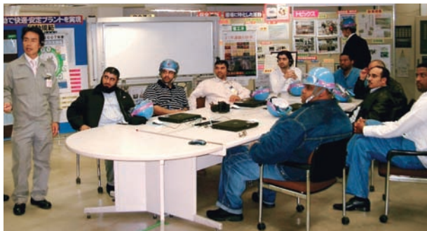
出光興産(株) 千葉製油所

続いて実施した各社での実地研修は、具体的な取り組みとその実態を確認してもらいました。出光興産(株)千葉製油所では、運転課でのTPM活動における自主保全活動を運転制御室において実際の活動板で説明を受け、効率化や改善事例・品質管理の実態を確認しました。さらに、実装置内での活動状況を確認することで活動の実態に直接触れることができ、また活発な質疑応答がなされ大変好評でした。